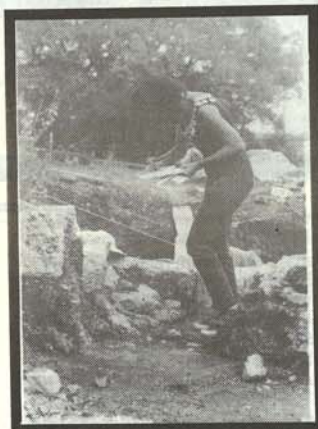
La documentazione di una fase di scavo

esempio, mentre finora sembrava che la ceramica altomedioevale fosse tutta di produzione locale e difficilmente classificabile in tipologie e cronologie, oggi ci stiamo rendendo conto, con sempre maggiore chiarezza, che anche nei cosiddetti "secoli bui" c'era una vivace circolazione delle merci; diventa sempre più realistica, quindi, la possibilità di effettuare agganci cronologici per le fasi posteriori alla fine del VII secolo. È chiaro che tutto questo non deriva soltanto dai risultati del nostro scavo, ma è il frutto dei confronti tra i nostri reperti e quelli che stanno emergendo dai numerosi scavi altomedioevali realizzati in Italia nell'ultimo decennio. Per quello che riguarda Roselle in particolare, poi, con il procedere degli scavi la fase di abbandono della città appare sempre più complessa. Non sembra, infatti - come si è detto in altre occasioni - che la città sia stata abbandonata dopo il trasferimento della sede vescovile; piuttosto si è riorganizzata e ristrutturata, secondo il nuovo schema insediativo del castello, con la costruzione di fortificazioni di tecnica non raffinata, ma senz'altro imponenti. Sono venuti fuori anche elementi che costituiscono delle vere e proprie curiosità: il cimitero si imposta su un enorme strato di immondizia tardo-antica,