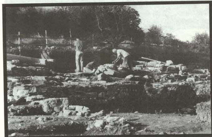
Panoramica del cimitero

re i limiti del cimitero. Cominceremo anche a pensare alla fruizione dell'area, in collaborazione con la Soprintendenza, che per la sovrapposizione di strutture di tanti periodi diversi, è di difficile comprensione per il visitatore.